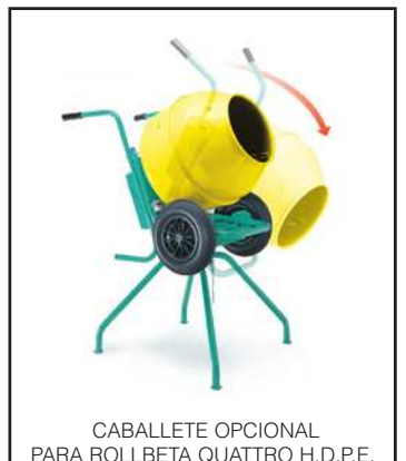
CABALLETE OPCIONAL PARA ROLLBETA QUATTRO H.D.P.E.

La basculación de la cuba es simple y segura. El caballete OPCIONAL IM2 1105490, gracias a sus cuatro puntos de apoyo, confiere a la ROLLBETA QUATTRO H.D.P.E. la máxima estabilidad.