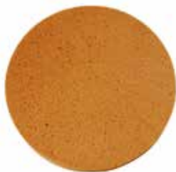
Disco de esponja