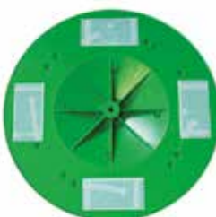
Plato de fijación