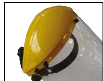
Visera de chorro S-128