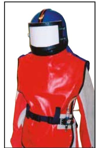
Equipo de protección modelo F-010