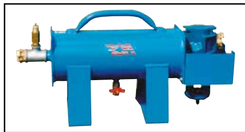
Depurador de aire modelo P-110 (6m³/min)