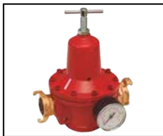
Regulador de presión S101 desde 4 bar hasta 8 bar, con acoplamientos