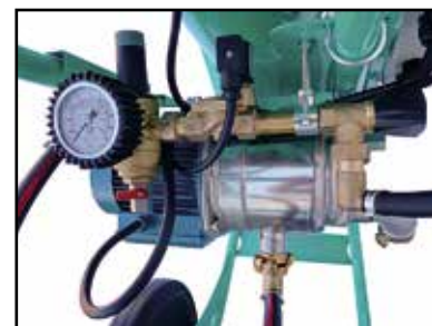
Bomba de agua autocebante con carcasa de acero inoxidable e impulsor de latón.