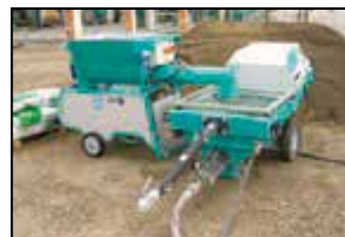
Ideal para trabajar con la enfoscadora modelo STEP-120.

Transmite la potencia del motor a las palas de mezcla mediante un reductor con engranajes de acero tratado en baño de aceite. Con este sistema directo de transmisión, se garantiza unas prestaciones más elevadas, eliminándose las típicas averías que se producen por el sistema de transmisión de la potencia mediante correas.